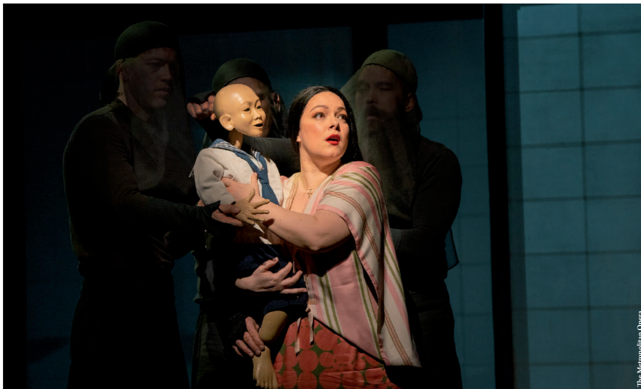
Como Madama Butterfly en la Metropolitan Opera House de Nueva York

Strauss dirigida por Michele Mariotti o, siguiendo en el terreno sinfónico que la soprano estima particularmente, en Luxemburgo y Viena con la Petite Messe Solennelle de Rossini dirigida por Gustavo Gimeno (editada por Pentatone en 2019).